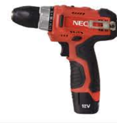
Li 1612 دریل و پیچ گوشتی شارژی باتری لیتیوم کره