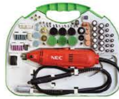
1720 فرز انگشتی گلوکوتاه دیمردار