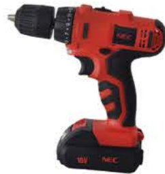
Li 1613 دریل و پیچ گوشتی شارژی باتری لیتیوم کره